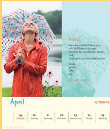
Gestaltung der Kalenderseiten